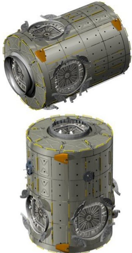
ESA-utvecklad Node 2 (överst), fästpunkten till Columbus-laboratoriet och Node 3 (underst). Node 3 kommer att utgöra fästpunkten för Cupola-enheten.

Noder är trycksatta moduler som sammanbinder ISS forsknings-, bonings-, kontroll- och docknings-