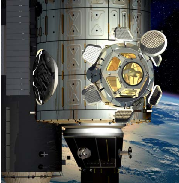
Ritning av Cupola-observationsmodulen fastsatt till Node 3.

Cupola kommer att bli ett panoramakontrolltorn för den internationella rymdstationen, en kupolformad modul med fönster via vilka operationer på stationens utsida kan observeras och styras. Det är ett trycksatt observations- och arbetsutrymme som kommer att hysa kommando- och kontrollarbetsstationer samt annan hårdvara.