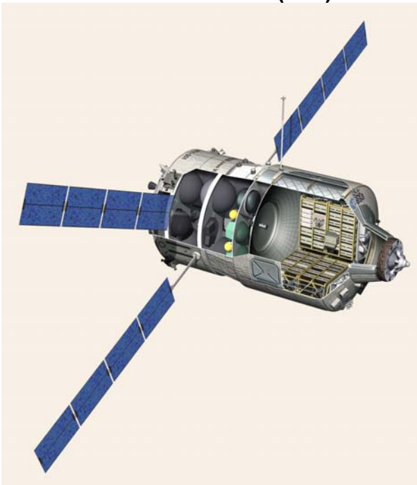
Automated Transfer Vehicle.

Automated Transfer Vehicle är Europas obemannade transportfarkost för ISS. Den kommer att kunna ta upp till 9 ton last till ISS, lyfta stationen till en omloppsbanan på högre altitud och avlägsna 6,5 ton avfall från stationen. Den mäter ungefär 10 meter på längden och har en diameter på 4,5 meter och har solpaneler som spänner över mer än 22 meter för generering av elkraft. Lasten som transporteras kommer att inkludera trycksatt last, vatten, luft, kväve, syre och drivmedel för attitydskontroll. Den första planerade uppsändningen är i mitten av 2007.