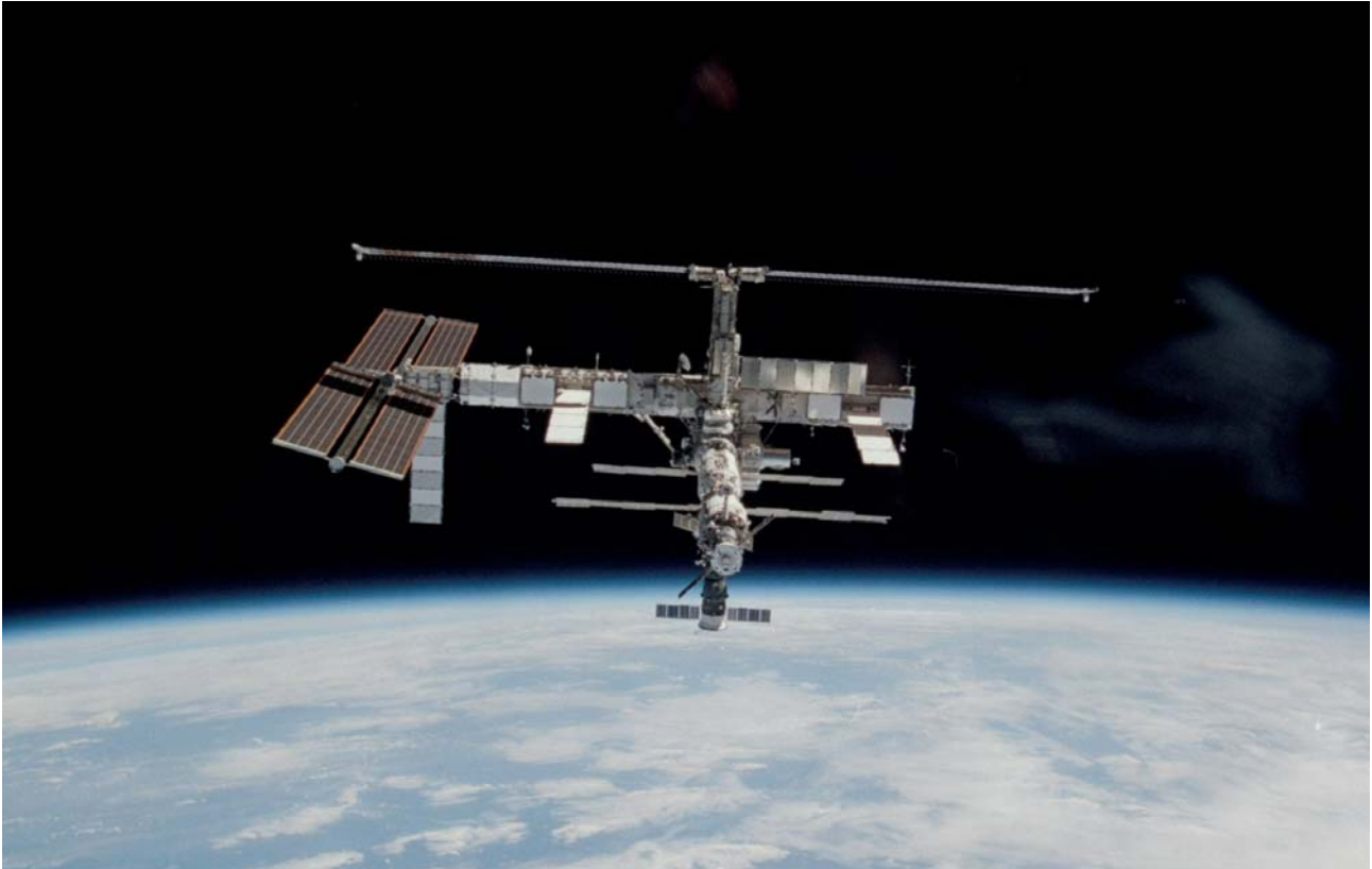
Foto på den internationella rymdstationen taget från rymdfärjan Atlantis 17 september 2006

Den internationella rymdstationen är ett samarbetsprogram mellan USA, Ryssland, Kanada, Japan och tio medlemsländer från den europeiska rymdorganisationen (Belgien, Danmark, Frankrike, Tyskland, Italien, Nederländerna, Norge, Spanien, Sverige och Schweiz).