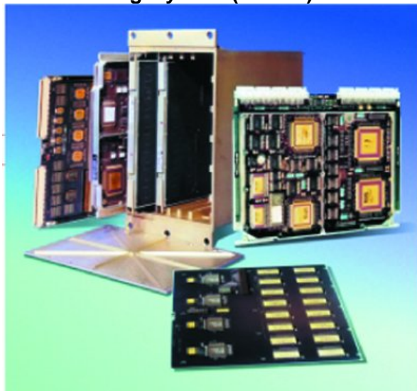
Det europabyggda datahanteringssystemet.

Europas datahanteringssystem DMS-R blev i juli 2000 den första europeiska hårdvaruenheten på ISS. Det inkluderar två feltoleranta datorer och två kontrollposter. Det är "hjärnan" eller kontrollcentrat för den ryska delen av ISS och utför en omfattande del av de vitala och grundläggande