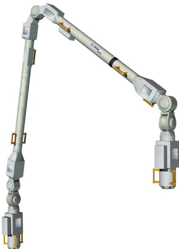
Den europeiska robotarmen (ERA).

moduler. Noderna används för att kontrollera och fördela resurser mellan de sammanlänkade enheterna. ISS kommer att ha tre noder. Node 1, som kallas Unity, utvecklades av NASA. Det blev den andra ISS-modulen i omloppsbana efter att den sändes upp i december 1998. Node 2 och Node 3 är utvecklade under ett ESA-kontrakt med europeisk industri där Alenia Spazio är huvudentreprenör.