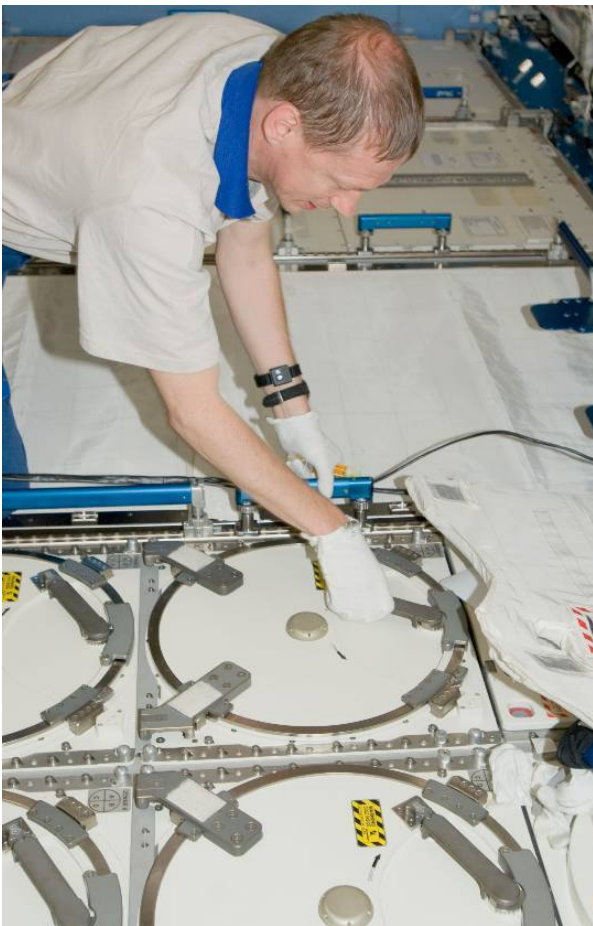
ESA-astronauten Frank De Winne sätter in prover i MELFI i det japanska Kibo-laboratoriet på ISS den 6 juni 2009.

Den andra minus åttio graders laboratoriefrys för ISS (MELFI-2) kommer att transporteras till ISS vid STS-128-uppdraget. Det är en enhet stor som ett rack och den förser rymdstationen med kylutrymmen för förvaring och snabbinfrysning av medicinska och biologiska prover. Den kommer inte att vara igång när den transporteras i MPLM-modulen som är installerad i rymdfärjans lastrum. MELFI designades för 10 års drift, men tack vare nya reservdelar och avancerade underhållsjobb från europeisk industri kommer den att kunna stanna i omloppsbana under ISS hela livstid.