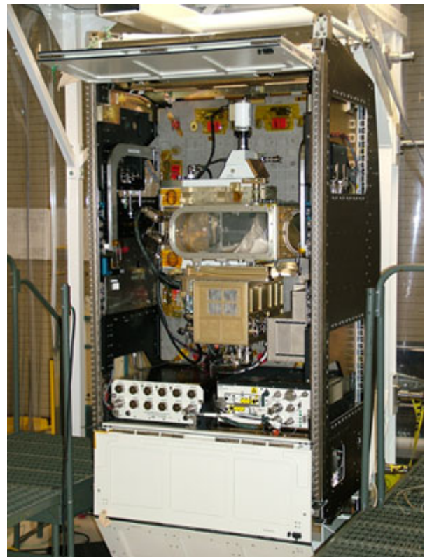
Vätskeexperimentrackets FIR visas med dörren öppen och det första experimentet inuti.

FIR-enheten (Fluids Integrated Rack) ska användas för att utföra vätskeexperiment i det amerikanska Destiny-laboratoriet. Enheten tar upp hälften av vätske- och förbränningsanläggningen där man arbetar med vätskor och förbränningsprocesser i tyngdlöshet. Med FIR kommer resurser för datainsamling och -kontroll, sensorgränssnitt, laserkällor och källor för vitt ljus, avancerad avbildningskapacitet samt kraft- och kylningsenheter. Den kan användas för många olika experiment. Vätskefysikforskningen fokuseras på komplexa vätskor, gränsyttefenomen, dynamik och instabilitet, flerfasflöden och fasövergång. Experimenten omfattar allt från grundforskning till teknikutveckling som stöder NASA:s olika forskningsuppdrag, inom områden som livsuppehållande system, kraftsystem, drivsystem och värmekontrollsystem