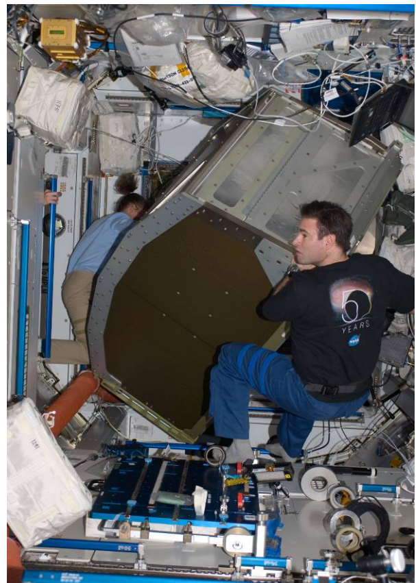
NASA-astronauterna Greg Chamitoff och Sandra Magnus flyttar ett sovrumrack under STS-126-uppdraget den 19 november 2008.

De nya sovrummen ger var och en av stationens invånare tillgång till en avdelning där de kan förvara sina personliga saker, sova och spendera fritiden i. I varje enhet finns det lampor, ljus- och ljudisolering och dessutom anslutningsmöjligheter för en laptop. De nya besättningssovrummen ska installeras i det japanska Kibo-laboratoriet. De är helt nödvändiga med tanke på att ISS-expeditionens permanenta besättning kommer att utökas till 6 medlemmar.