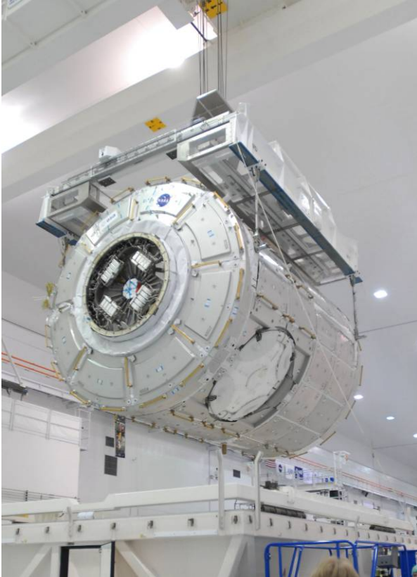
En kran lyfter den europeiska Nod 3 från sin transportcontainer den 26 maj 2009.

Luftreningssystemet (Atmospheric Revitalization System) är ett av systemen för miljökontroll och livsuppehållande funktioner som ska placeras i den europeiska Nod 3 när den kommer till ISS i februari 2010. Systemet renar bort koldioxid och övervakar spårmängder av föroreningar och gassammansättningen i kabinen. Koldioxid från besättningen avlägsnas från kabinens atmosfär med hjälp av absorptionsbäddar som utformats för att absorbera koldioxid. Bäddarna regenereras genom exponering för värme och rymdvakuum. Ett övervakningssystem för spårmängder av föroreningar (Trace Contaminant Control System) ser till att över 200 olika kemiska föroreningar som bildas via materialavdunstning och besättningens ämnesomsättning håller sig inom tillåtna och säkra gränsvärden i de bebodda utrymmena. Gas analyseras av en masspektrometer och mäter syre, kväve, väte, koldioxid, metan och vattenånga i kabinen.