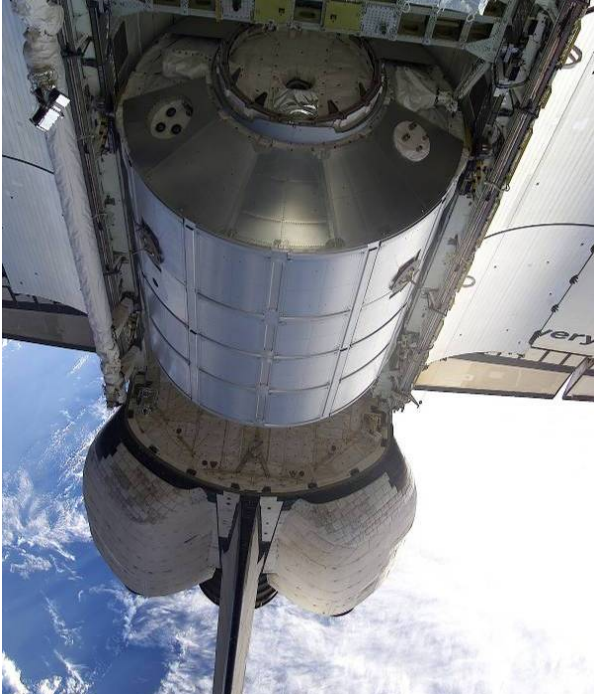
MPLM-modulen Leonardo i rymdfärjan Discoverys lastrum den 10 mars 2001

MPLM är trycksatta lastcontainrar som transporteras i rymdfärjans lastrum. Tre av modulerna byggdes för den italienska rymdstyrelsen ASI av Thales Alenia Space i Turin. Modulerna, som fått namnen Leonardo, Raffaello och Donatello, är mycket viktiga enheter som används för leverans av material och förnödenheter till den internationella rymdstationen. Första gången Leonardo var uppe på stationen var i samband med uppdrag STS-102 i mars 2001 och den har använts vid fyra uppdrag sedan dess (STS-105, STS-111, STS-121 och STS-126). Raffaello dockade med ISS första gången i april 2001 under STS-100, uppdraget som förde Umberto Guidino som förste ESA-astronaut till ISS, och har använts två gånger sedan dess (STS-108 och STS-114).