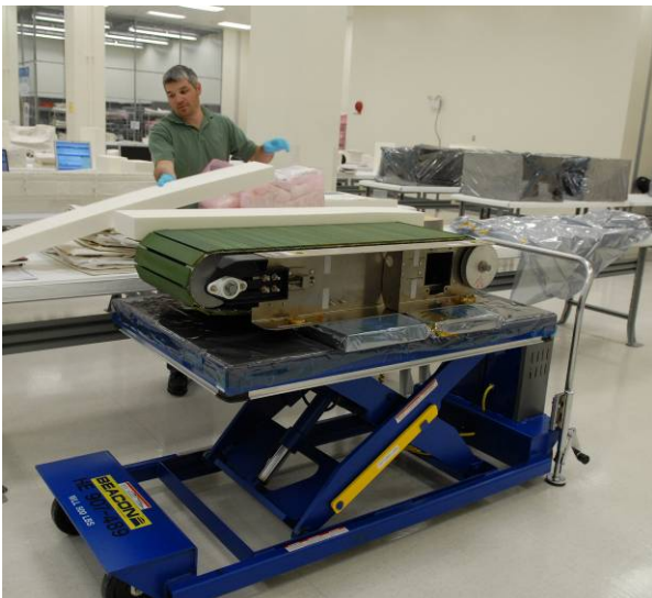
Löpbandet COLBERT för installation i en MPLM-modul.

COLBERT är ett nytt löpband som ska placeras i den europeiska Nod 2 (och senare i Nod 3). Det är ett viktigt träningsredskap för besättningen på ISS. Det är ett vanligt löpband som har anpassats för att inte orsaka skakningar i resten av ISS när det används. Vibrationsdämpningssystemet går inte på ström och är därför mer tillförlitligt. Astronauterna spänner elastiska band över axlarna och runt midjan för att de ska hålla sig kvar på bandet. Löpbandet är dessutom bredare än det som nu finns på stationen. Även om det är byggt för att klara 240 000 km löpning kommer det troligen att användas för omkring 60 000 km under sin tid i omloppsbana.