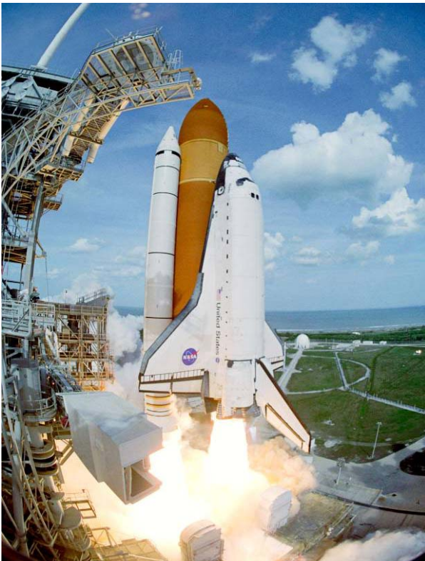
Uppsändningen av ESAs Columbus-laboratorium till den internationella rymdstationen den 7 februari 2008 ombord på rymdfärjan STS-122 Atlantis. ESA-astronauterna Hans Schlegel och Léopold Eyharts var besättningsmedlemmar på uppdraget.

Det är nu dags för ESA-astronauten Christer Fuglesang's andra uppdrag i rymden. Ombord på rymdfärjan Discovery ska han sändas upp till den internationella rymdstationen (ISS) från Kennedy Space Center i Florida på det europeiska uppdraget Alissé. Den största delen av uppdraget utgörs av de uppgifter Fuglesang ska genomföra under sina rymdpromenader som uppdrags-specialist på flygning STS-128 för ISS-påbyggnadsuppdrag 17A. Men under Alissé-uppdraget ska Fuglesang också genomföra experiment och delta i utbildnings- och PR-aktiviteter.