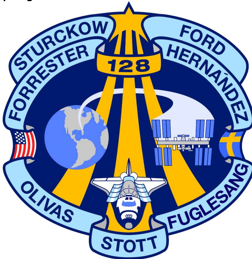
STS-128 uppdragsemlen

STS-128 uppdragsemlen symboliserar uppdrag 17A och representerar utrustningen, människorna och samarbetsländerna som bidrar till rymdfärden. Rymdfärjan Discovery visas i omloppskonfiguration med den Europabyggda MPLM-modulen Leonardo stuvad i lastrummet. Det här blir fjärde gången som Leonardo flyger med Discovery.