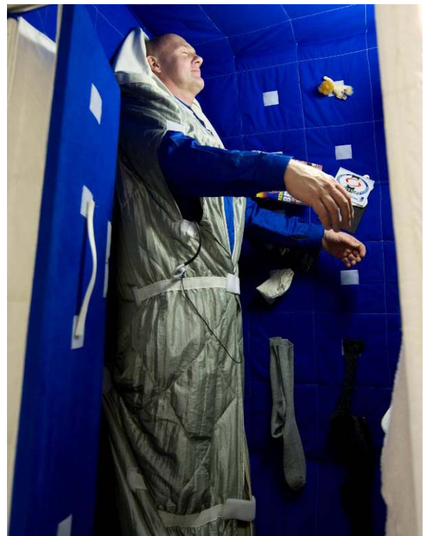
ESA-astronauten André Kuipers prövar en sängmodell vid det europeiska astronautcentret i tyska Köln.

Experimentutrustning: Utöver MSRR som bär ESA:s materialvetenskapliga laboratorium kommer även NASA:s FIR (Fluids Integrated Rack), en enhet för experiment med vätskor, att transporteras till ISS i MPLM och installeras i den amerikanska Destiny-modulen. Även ESA:s experiment SODI-IVIDIL, som undersöker hur vibrationer påverkar vätskors diffusion, ska skickas upp med STS-128 tillsammans med viktiga förbrukningsartiklar för experiment som undersöker den mänskliga fysiologin.