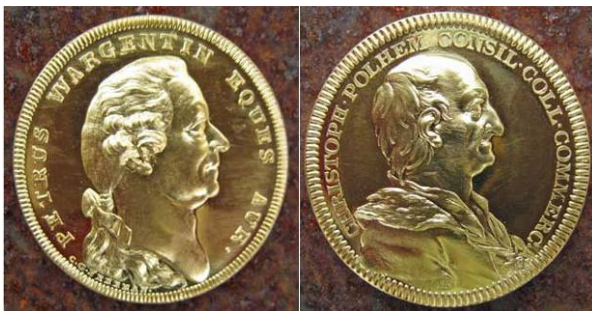
Wargentinmedaljen (till vänster) och Polhemmedaljen (till höger).

Wargentinmedaljen för den kungliga vetenskapsakademien: Akademien har en framstående historia och har bland annat i uppdrag att välja ut Nobelpristagarna i fysik och kemi. Det här minnesmyntet, som sedermera blev Wargentinmedaljen, präglades 1783 efter bortgången av Pehr Wilhelm Wargentin, en astronom och Akademiens ständige sekreterare mellan åren 1743 och 1783.