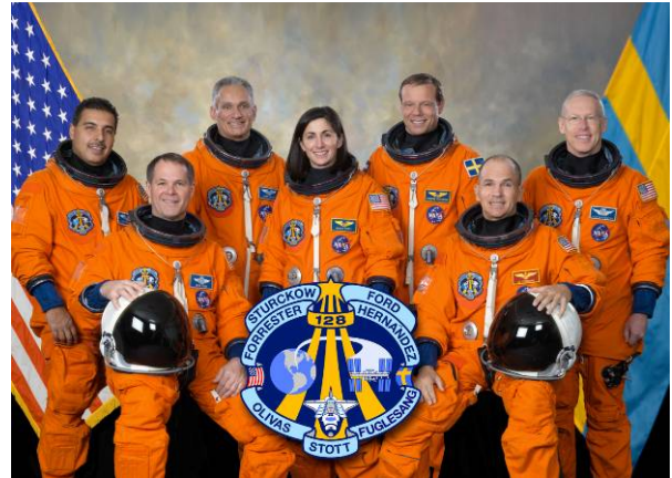
STS-128 besättning. Bakre raden från vänster: Jose Hernandez, John Olivas, Christer Fuglesang och Patrick Forrester. Framre raden från vänster: Kevin Ford, Nicole Stott och Rick Sturckow.

Överenskommelsen innebar bl.a. att ESA fick två rymdfärder med ESA-astronauter och att europeiska forskare fick rätt att utnyttja resurser på ISS inför uppsändningen av Columbus-laboratoriet.