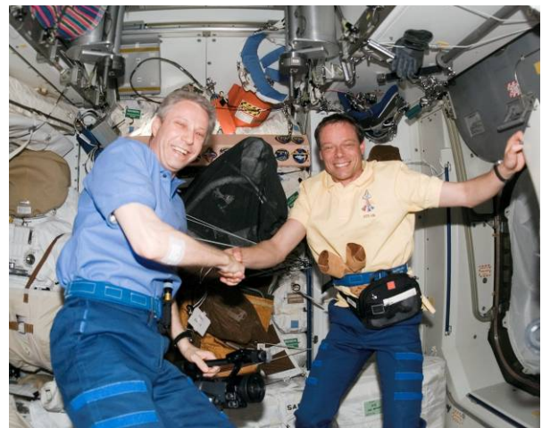
ESA-astronauten Christer Fuglesang (till höger) skakar hand med Thomas Reiter, ESA-astronaut och besättningsmedlem vid ISS expedition 14, när han kommer till ISS den 11 december 2006.

Två ESA-astronauter på stationen: Även på Fuglesangs andra uppdrag möts han av en ESA-astronaut som är en av besättningsmedlemmarna på ISS. Den här gången är det ESA-astronauten Frank De Winne. Vid Fuglesangs förra uppdrag möttes han av ESA-astronauten Thomas Reiter.