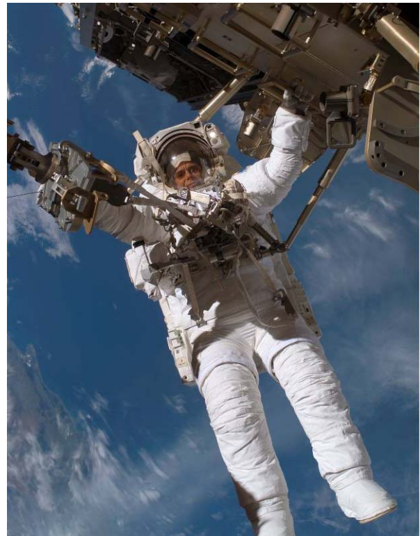
ESA-astronauten Christer Fuglesang på en av rymdpromenaderna vid STS-116 den 14 december 2006.

De viktigaste uppgifterna vid uppdraget är: