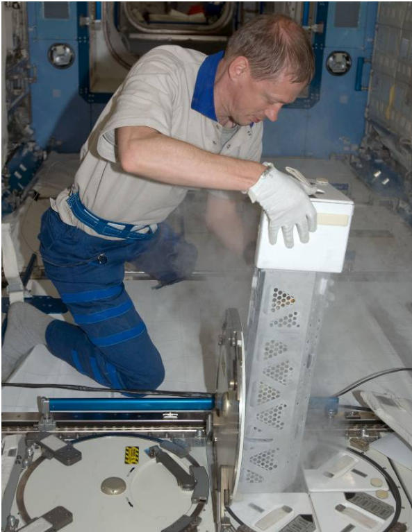
ESA-astronauten Frank De Winne stoppar in prover i en MELFI-frys i Kibo-laboratoriet på ISS den 6 juni 2009.

hamnar på rätt ställe på ISS. En MPLM är en trycksatt lastcontainer som transporteras i rymdfärjans lastrum och kan föra med sig mer än 9 ton last. I detta uppdrag används en MPLM som döpts till Leonardo och den kommer att föra med sig en standardlast av förnödenheter till ISS och dessutom följande specialutrustning: