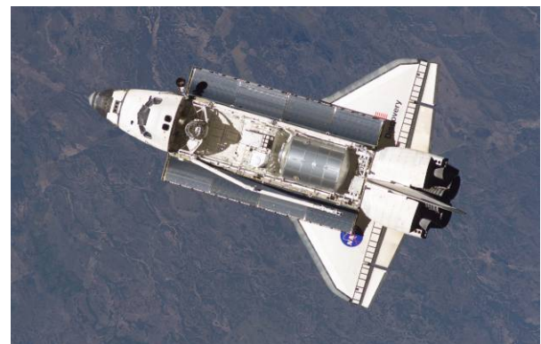
Rymdfärjan STS-121 Discovery innan hon dockar med ISS den 6 juli 2006. Uppdraget transporterade en MPLM (syns tydligt i färjans lastrum) och förde med sig ESA-astronauten Thomas Reiter, den förste europeiske besättningsmedlemmen på ISS

Ytterligare EVA-uppgifter är att konfigurera kablar och ersätta ett trasigt elskåp.