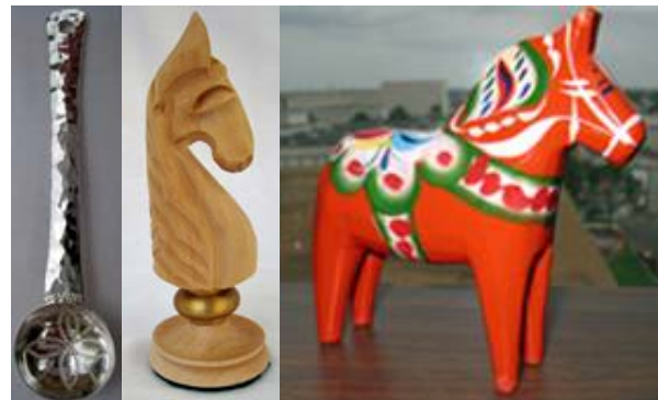
Från vänster till höger: En samesked, en schackpjäs från den svenska schackakademien och en dalahäst.

Silversked för sametinget: Sametinget är en unik del av det svenska kulturarvet. Ända sedan medeltiden har samerna använt silver eftersom metallen ansågs hållbar och värdefull. Silverskedar som fått sin form från skedar gjorda av horn var mycket eftersökta ting.